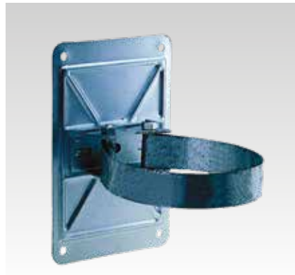
Montage mit ML-Bandschelle