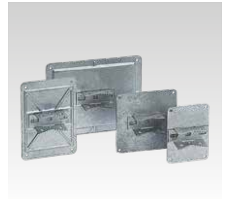
Für Profile 38/24 bis 40/120